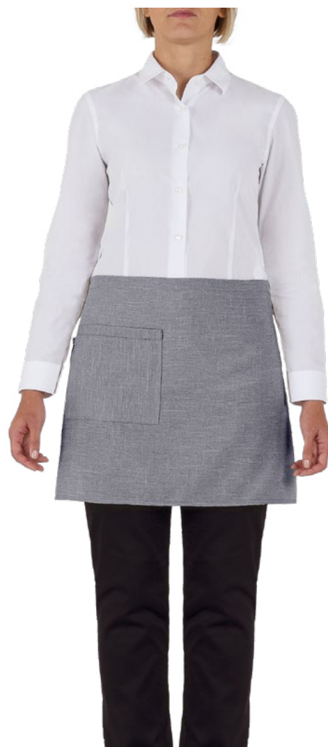
019 Grigio chiaro